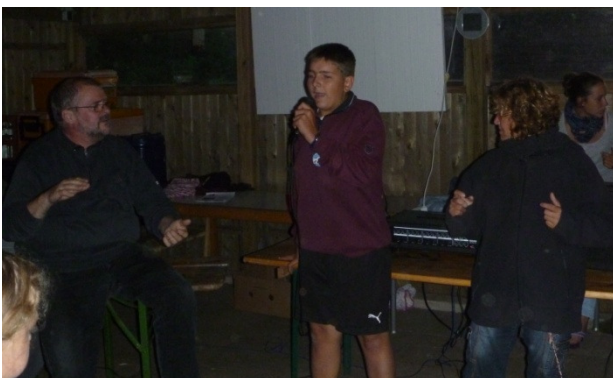
Ein Traum wird wahr