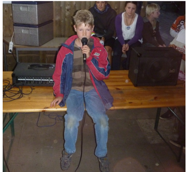
Unser Superstar 2010