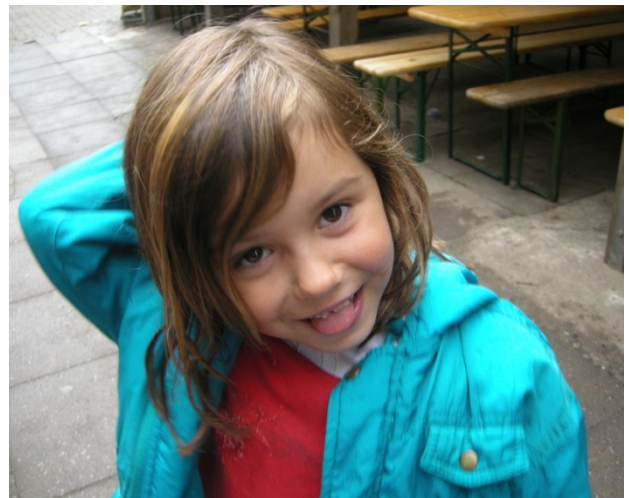
Eine unserer Jüngsten!

Das Team 2010 wünsch Euch viel Spaß im Hansapark!